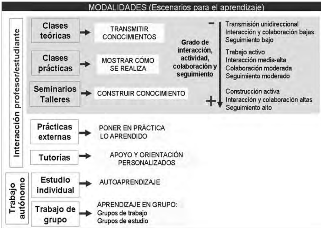
Cuadro 1: Los escenarios o modalidades definidos por Mario de Miguel, adaptados a la UNED mediante la categorización de espacios de interacción profesor/estudiante y espacios de trabajo autónomo del estudiante.

Por otro lado, otra diferencia en relación con la implementación de estas modalidades y escenarios en la UNED tiene que ver con la necesidad del recurso a medios tecnológicos para facilitar los tipos de interacción que requiere cada una de estas modalidades.