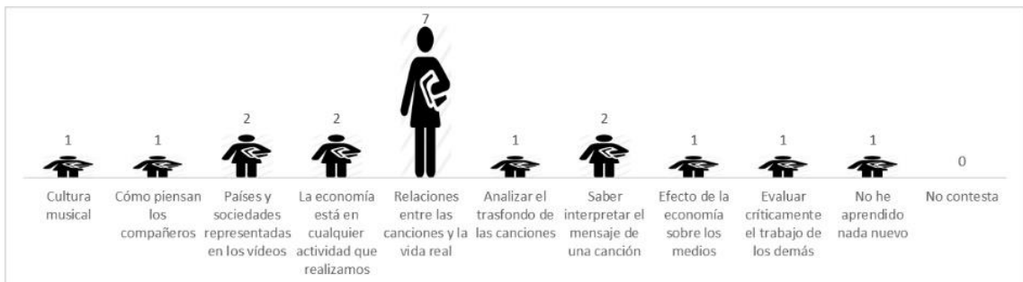
Figura 4. Respuestas recibidas y número acerca del aprendizaje

Cuando se les preguntó qué habían aprendido con la realización de la práctica, la mayoría del alumnado respondió cuestiones que relacionaban las temáticas de las canciones con problemáticas cotidianas de la sociedad. También consideraron que habían aprendido a interpretar de manera más adecuada el mensaje y el trasfondo de una canción, conocer cómo piensan otros compañeros respecto a diferentes temas y a evaluar críticamente el trabajo de terceros. Un único estudiante consideró también que la actividad no le había aportado nada nuevo (Figura 4).