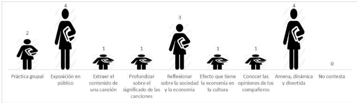
Figura 2. Respuestas recibidas y número acerca de los puntos positivos de la realización de la práctica

En cuanto a los puntos negativos, el 18% del alumnado dejó la pregunta en blanco. Las respuestas estuvieron relacionadas con la falta de preparación o de interés por parte de ciertos grupos en la realización de la práctica, y por la elección de videoclips cuya información era escasa para relacionarla con conceptos vistos en las clases teóricas. Asimismo, algunos estudiantes consideraron que la actividad era muy extensa, tanto por el tiempo invertido en las clases, como por la realización de la práctica en sí (búsqueda de videoclip, análisis y presentación oral y escrita) (Figura 3).